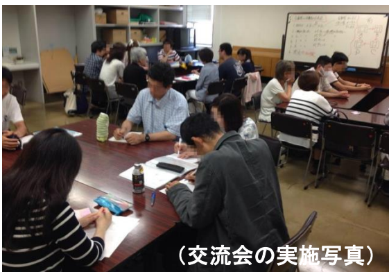
(交流会の実施写真)

午後からは、今回初めてダンボクラブ保護者と交流会をしました。四班に分かれて、各班に当事者と保護者が三〜四人ずつに分かれて話をしました。当事者、保護者の悩みや状況を聞いてそれについて討論をしました。保護者と当事者が同じ班になると当事者の方が別の班に移動している方もいました(笑)。いろいろ話を聞くことができて良かったと思います。