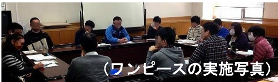
(ワンピースの実施写真)

活動内容として「自己理解」「居場所作り」「ソーシャルスキルトレーニング」を行っています。上記の活動には、当事者だけでなく支援者も参加しています。今年度は自助グループをして当事者を中心とした運営を行っていく予定です。