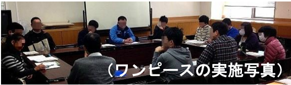
(ワンピースの実施写真)

「居場所作り」「ソーシャルス キルトレーニング」を行ってい ます。上記の活動には、当事者 だけでなく支援者も参加して います。今年度は自助グループ として当事者を中心とした運 営を行っていく予定です。