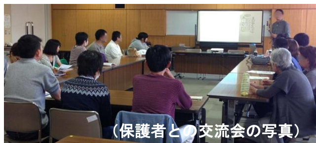
(保護者との交流会の写真)

午後からは、保護者との交流会という事 で、ワンピースに参加されている方の保護 者が多く参加されました。ワールドカ フェという形式で、参加者と保護者がまん べんなく4つのグループに分かれて、障害 の特性をどの様に理解してもらったら良い か、親として障害をどの様に理解してあげ たら良いかなどをテーマにして、参加者と 保護者で意見を出し合い、お互いに理解を 深めることができましたと思います。