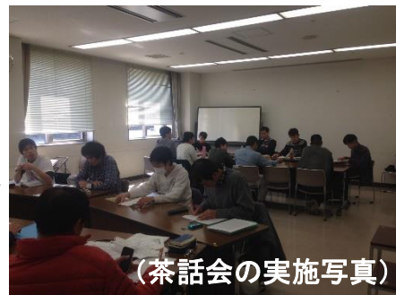
(茶話会の実施写真)

午前は、茶話会をしました。「人と話をするとき、喋ることと話を聞くことの違い」や「電車の障害者割引についてどう思う?」ということについて話をしました。