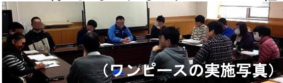
(ワンピースの実施写真)

活動内容として「自己理解」「居場所作り」「ソーシャルスキルトレーニング」を行っています。上記の活動には、当事者だけでなく支援者も参加しています。今年度は自助グループとして当事者を中心とした運営を行っています。詳しくはウェブサイトをご覧ください。